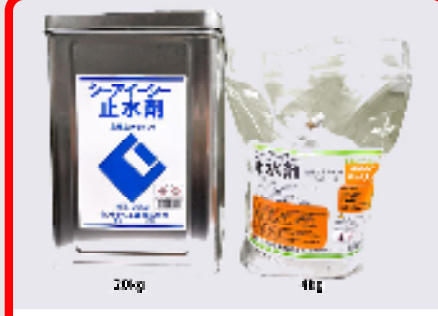
CIC止水剤 規格: 20kg・4kg 用途: 接着性隣結止水セメント