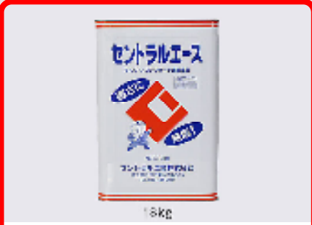
セントラルエース(無塩タイプ) 規格: 18kg 用途: 寒中期におけるモルタル、コンクリートの凍結防止用