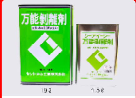
CIC万能剥離剤 規格: 18L・4.5L 用途: 金枠・木枠両用(原液使用)