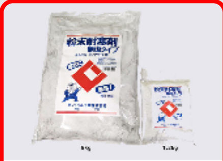
CIC粉末耐寒剤(無塩タイプ) 規格: 9kg・1.2kg 用途: 寒中期におけるモルタル、コンクリートの凍結防止用