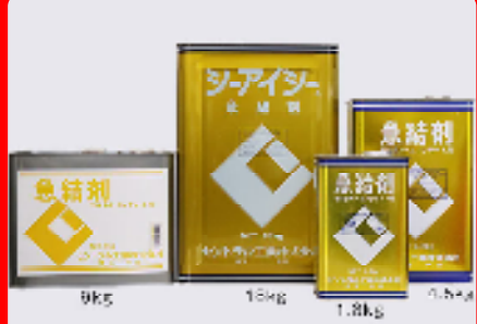
CIC急結剤 規格: 18kg・9kg・4.5kg・1.8kg 用途: セメントの急速硬化用