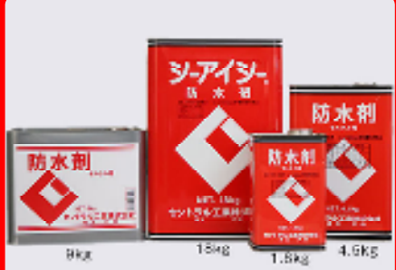
CIC防水剤 規格: 18kg・9kg・4.5kg・1.8kg 用途: モルタルの防水・防湿用