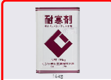
CIC耐寒剤(塩カルタイプ) 規格: 18kg 用途: 寒中期におけるモルタル、コンクリートの凍結防止用