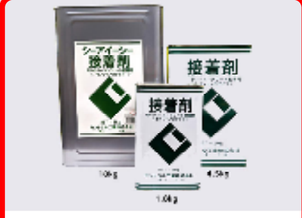
CIC接着剤(セメントノロタイプ) 規格: 18kg・4.5kg・1.8kg 用途: モルタル、コンクリート密着用