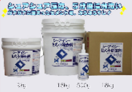
CICセメント除去剤 規格: 18kg・18kgイコ・9kg・500g 用途: セメント・モルタル・コンクリートの除去