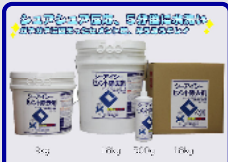
CICセメント除去剤 規格: 18kg・18kg缶・9kg・500g 用途: セメント・モルタル・コンクリートの除去