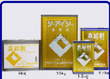
CIC急結剤 規格: 18kg・9kg・4.5kg・1.8kg 用途: セメントの急速硬化用