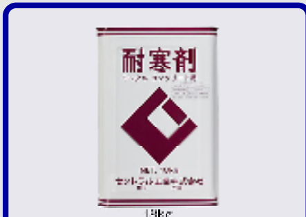
CIC耐寒剤(塩カルタイプ) 規格: 18kg 用途: 寒中期におけるモルタル、コンクリートの凍結防止用