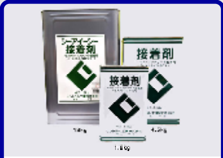
CIC接着剤(セメントノロタイプ) 規格: 18kg・4.5kg・1.8kg 用途: モルタル、コンクリート密着用