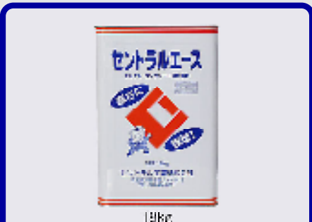
セントラルエース(無塩タイプ) 規格: 18kg 用途: 寒中期におけるモルタル、コンクリートの凍結防止用