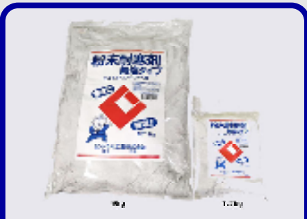
CIC粉末耐寒剤(無塩タイプ) 規格: 9kg・1.2kg 用途: 寒中期におけるモルタル、コンクリートの凍結防止用