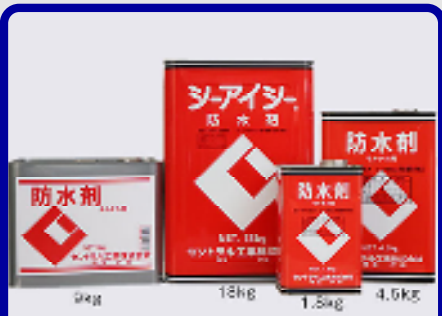
CIC防水剤 規格: 18kg・9kg・4.5kg・1.8kg 用途: モルタルの防水・防湿用