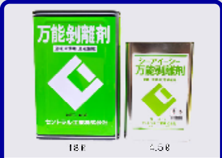
CIC万能剥離剤 規格: 18L・4.5L 用途: 金柁・木柁両用(原液使用)