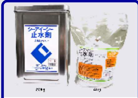
CIC止水剤 規格: 20kg・4kg 用途: 接着性瞬結止水セメント