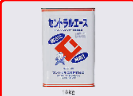
セントラルエース(無塩タイプ) 規格: 18kg 用途: 寒中期におけるモルタル、コンクリートの凍結防止用