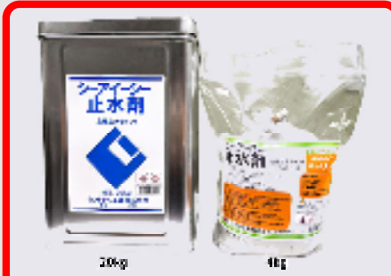
CIC止水剤 規格: 20kg・4kg 用途: 接着性隣結止水セメント