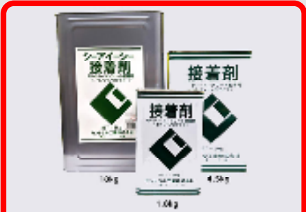
CIC接着剤(セメントノロタイプ) 規格: 18kg・4.5kg・1.8kg 用途: モルタル、コンクリート密着用