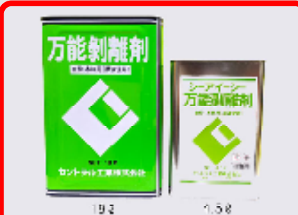
CIC万能剥離剤 規格: 18L・4.5L 用途: 金枠・木枠両用(原液使用)