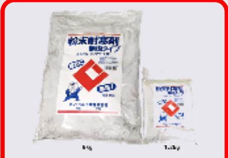
CIC粉末耐寒剤(無塩タイプ) 規格: 9kg・1.2kg 用途: 寒中期におけるモルタル、コンクリートの凍結防止用