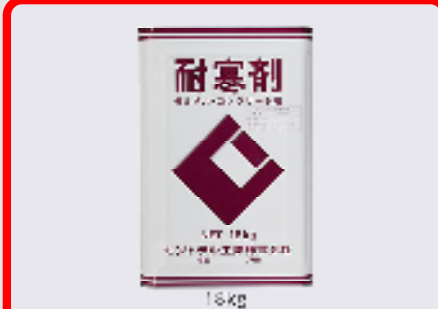
CIC耐寒剤(塩カルタイプ) 規格: 18kg 用途: 寒中期におけるモルタル、コンクリートの凍結防止用