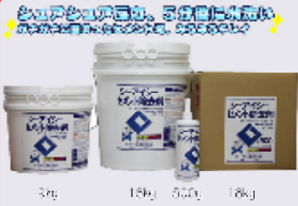
CICセメント除去剤 規格: 18kg・18kgイコ・9kg・500g 用途: セメント・モルタル・コンクリートの除去