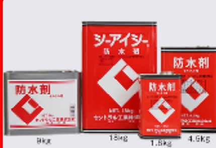
CIC防水剤 規格: 18kg・9kg・4.5kg・1.8kg 用途: モルタルの防水・防湿用